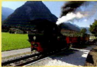
Autriche Zillertal Achensee 2015