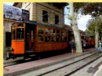
Baléares Palma Soller 2017

Pour nous trouver : RAMCAS - Cité du Train 2, rue Alfred de Glehn 68200 Mulhouse